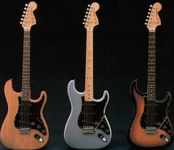
ストラトキャスター ナチュラル R N L Tr

そのスリリングなサウンドは、時代がどんなに変わっても常にエレクトリックギターの前点。 誕生25周年記念モデルを加えてまさに王者の風格。