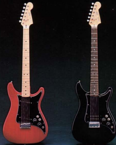
リードII ワイン M N

リ・ホット・フエンター ハムバッキングのリードIとシングルコイルのリードII、 ロクンロールを感じさせるロクンロールマシン。