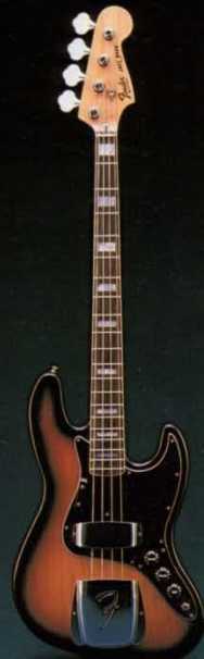
ジャズベース サンバースTR N

聴る重低音にベーストの音楽性を引き出すコントロール。堂々たる風格の2ヒックアップソリッドベース。