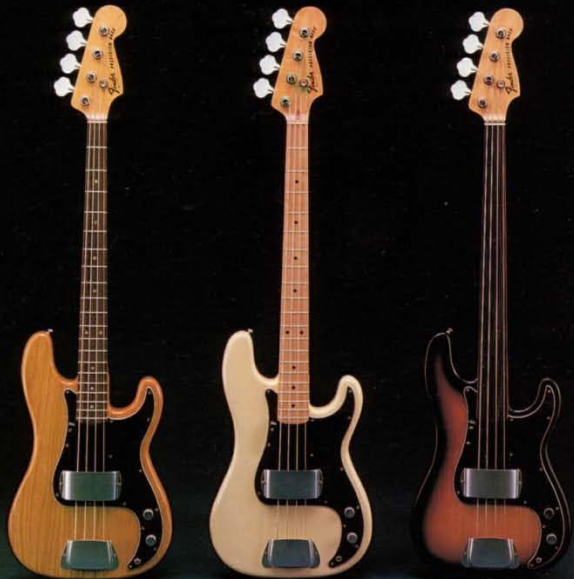
プレジションベース ナチュラルR NN プレジションベース ホワイトM N プレジションベース サンバースTR N FL

買めかいた重低音のサウンドホリシーに豊富なネックバリエーションがプレイスタイルを広げる。まさにスーパーソリッドベース。