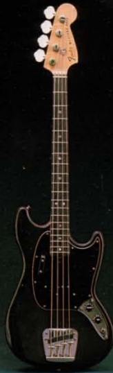
ムスタングベース ワインR.N