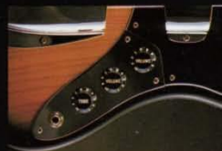
コントロールは、第1ヒックアップ、第2ヒックアップのボリュームコントロールとマスタートーンコントロール。