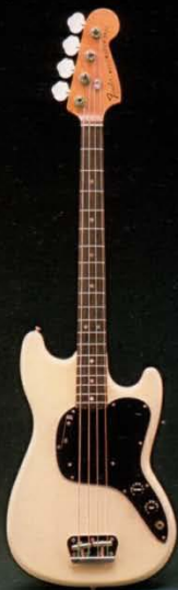
ミュージックマスターベース ホワイトR.N

フエンダーサウンドビシヨードスクールのマツクが ビギナー、プロを問わず日本トホフオマンズベース。